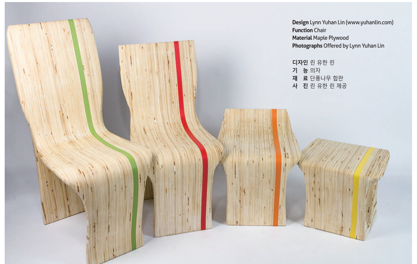
Design Lynn Yuhan Lin (www.yuhanlin.com) Function Chair Material Maple Plywood