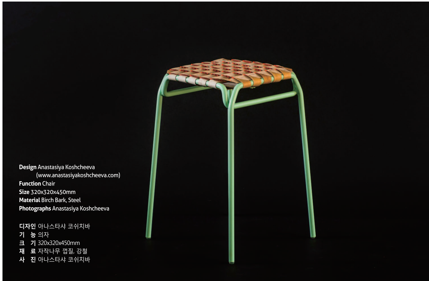
Design Anastasiya Koshcheeva (www.anastasiyakoshcheeva.com) Function Chair Size 320x320x450mm Material Birch Bark, Steel